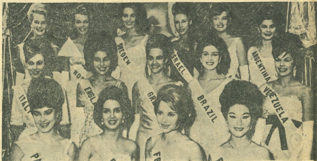
MIAMI BEACH — Le candidate finaliste al concorso per «Miss Universo». Da sinistra, in prima fila: Miss Paraguay, Miss Bolivia, Miss Francia, Miss Cina; in seconda fila: Miss Italia, Miss Inghilterra, Miss Grecia, Miss Brasile, Miss Venezuela. Ultima fila in terzo piano: Miss Svezia, Miss Israele, Miss Stati Uniti, Miss Argentina