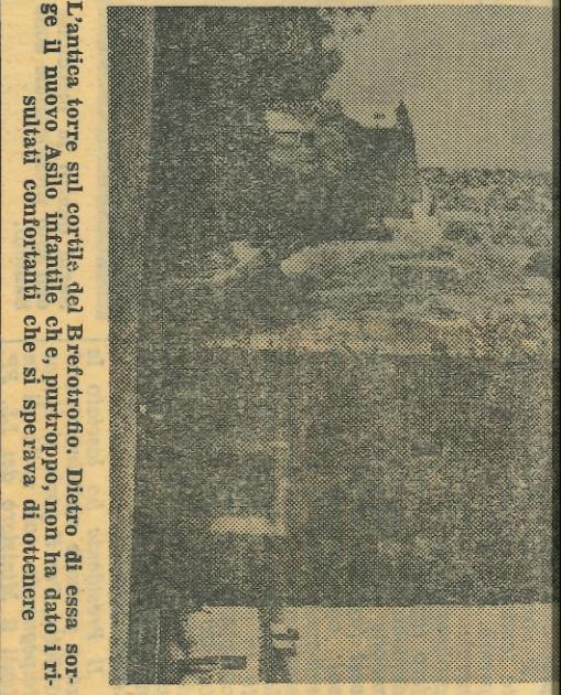
L'antica torre sul cortile del Bireforro. Dietro di essa sorge il nuovo Asilo infantile che, purtroppo, non ha dato i risultati confortanti che si sperava di ottenere

frontisti che lo Stato o la Regione ha messo a disposizione di chi ci amministra. In tutti i Comuni si lamenta il disinteresse da parte soprattutto della Regione per la soluzione almeno di quei problemi vitali per un vivere civile. Acqua, luce, fognage, case di abitazione, caseriggi scolastici, mattatoi, strade di penetrazione agraria, alberghi, sono gli eterni problemi che umiliano e rattristano tutta la vasta zona che da Benetutti si estende fino ad Illorai. Numerosissime pratiche, dai vari centri, sono da anni inoltrate agli uffici competenti regionali e comunali, ma senza mai una risposta, e sempre la stessa: «per questo esercizio non è possibile sovvenzionare l'opera da codesto Comune trattata per mancanza di fondi. Si terrà conto comunque nel prossimo esercizio». E così passano gli anni ed il Goceas non continua ad essere l'ultima nota dei carri Speriamo che anche questa nuova delibera dell'Amministrazione di Bono non vada a fare la fine di tante altre. Costertinu