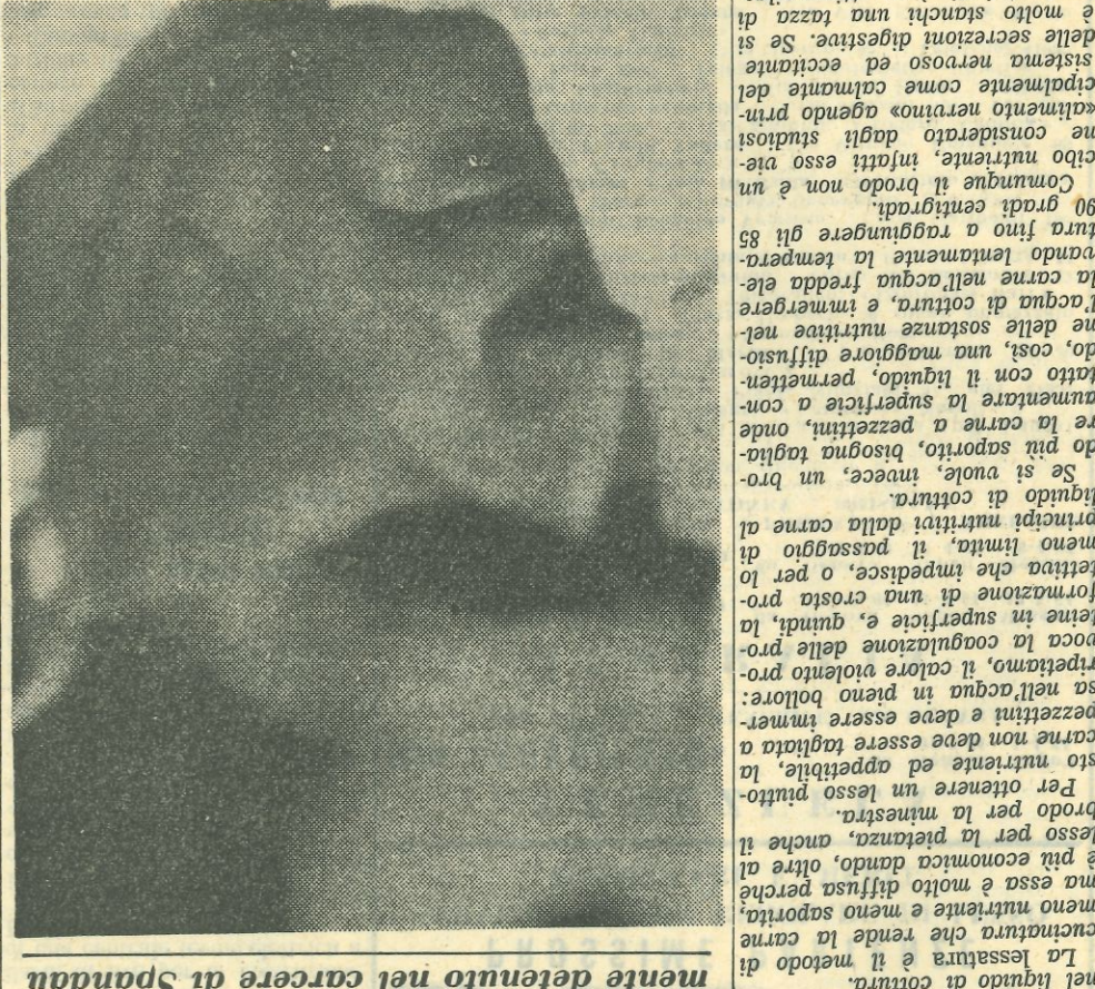
Rudolf Hess in una fotografia dell'epoca della guerra

Un nuovo, grande stabilimento del mondo economico della provincia di Treviso, in comune di Susegana. Un nuovo, grande stabilimento del mondo economico della provincia di Treviso, in comune di Susegana.